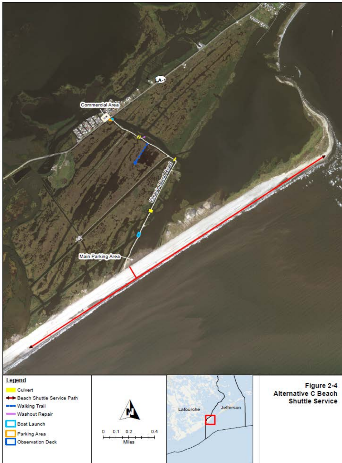
Hình 2. Chính Sửa Ưu Tiên Cho Phạm Vi Dự Án (Dịch Vụ Đưa Đón)