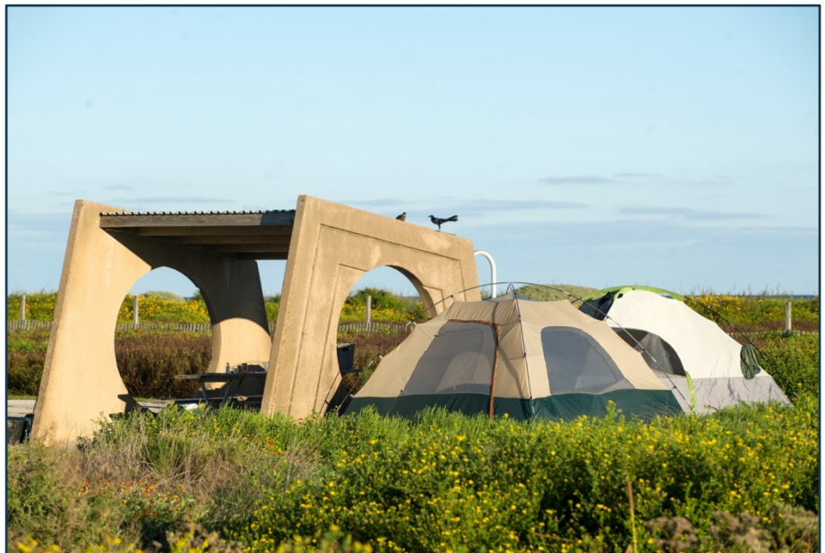
Dự án đề xuất sẽ xây dựng thêm nhiều khu cắm trại giống như trong hình, cộng với các tiện nghi khác.

Về tính lịch sử, các công viên tiểu bang cung cấp phương tiện cắm trại và các tiện nghi liên quan cho du khách sử dụng ban ngày và du khách qua đêm. Tuy nhiên, trong năm 2008 Bão Ike đã tàn phá bờ