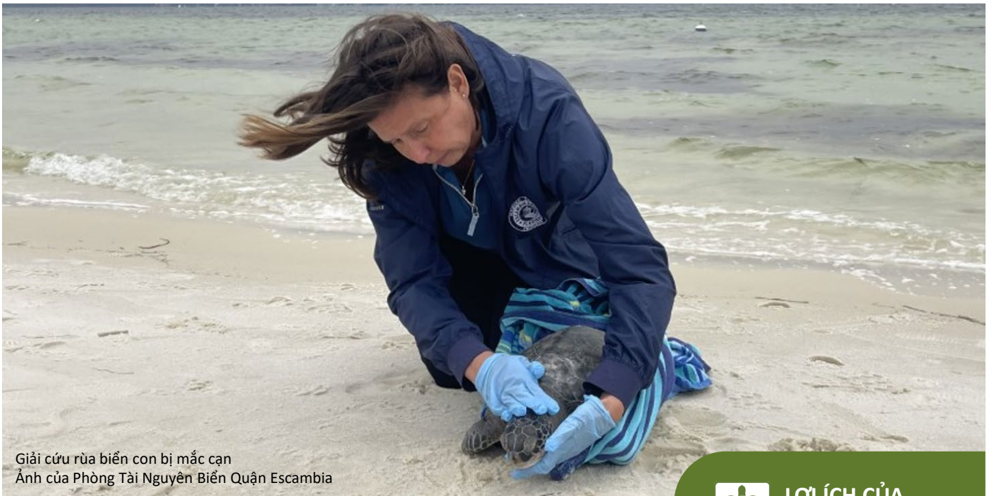
Giải cứu rùa biển con bị mắc cạn