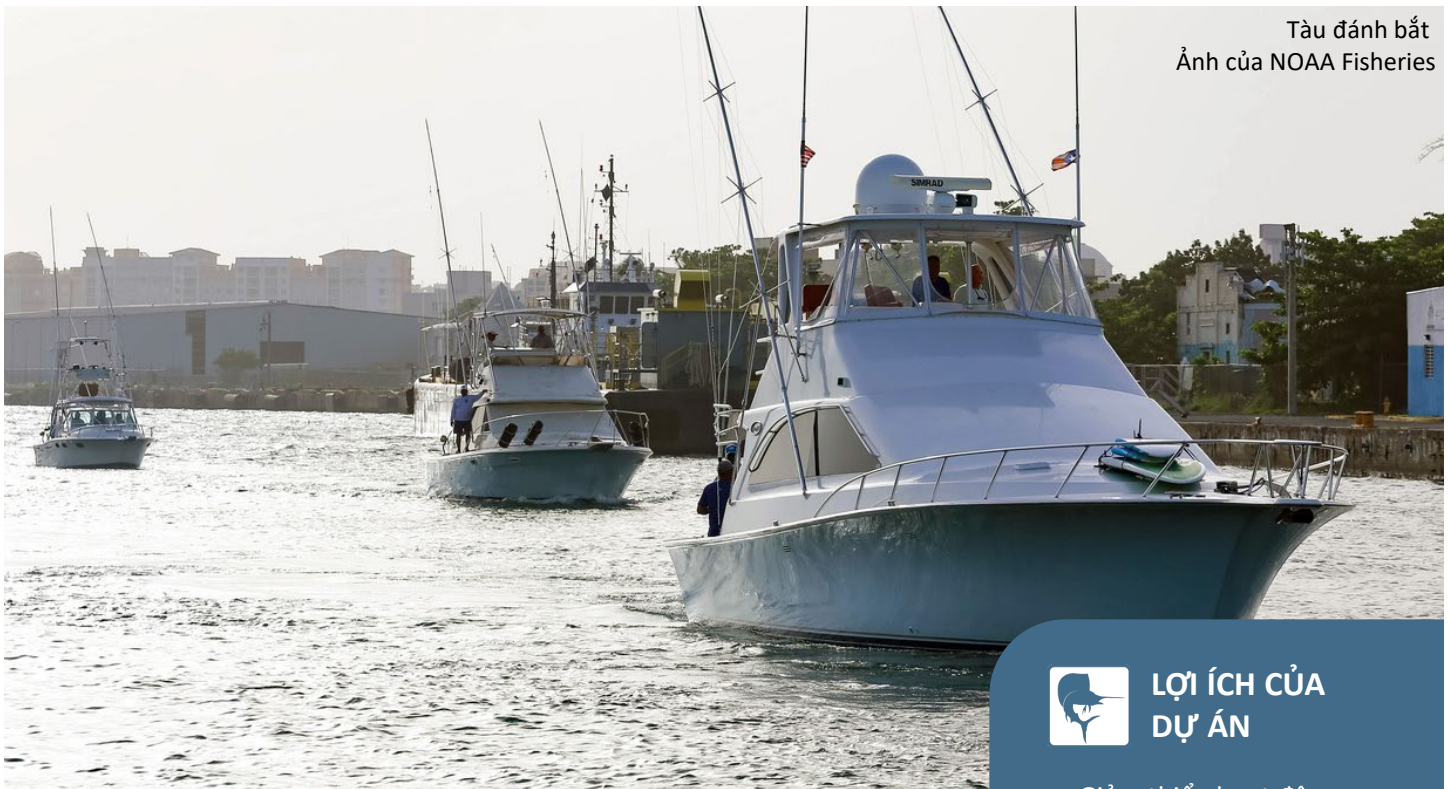
Tàu đánh bắt

LOẠI HÌNH KHÔI PHỤC: Cá và Động Vật Không Xương Sống ở Cột Nước