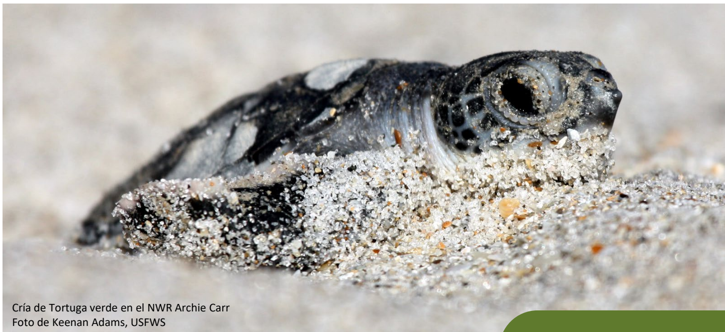
Cría de Tortuga verde en el NWR Archie Carr