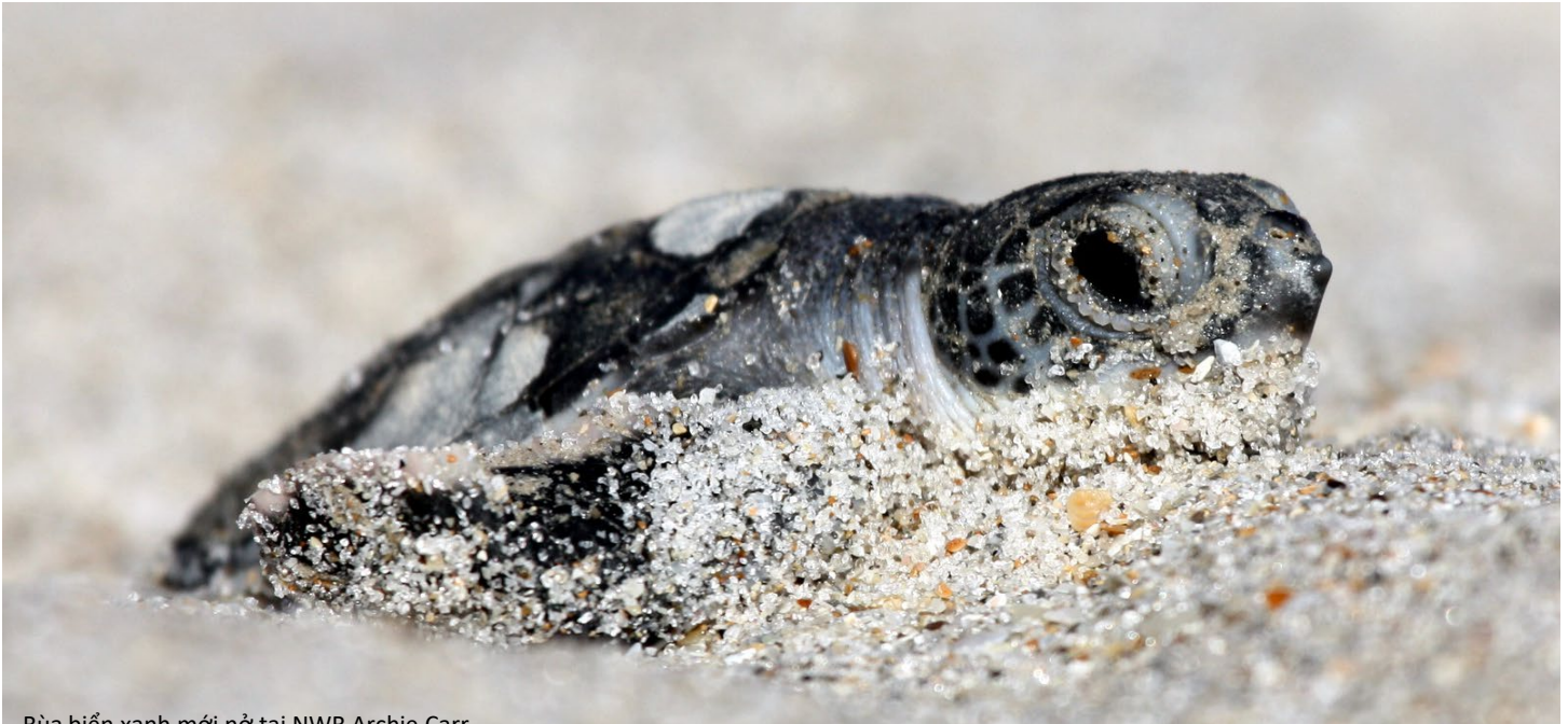
Rùa biển xanh mới nở tại NWR Archie Carr