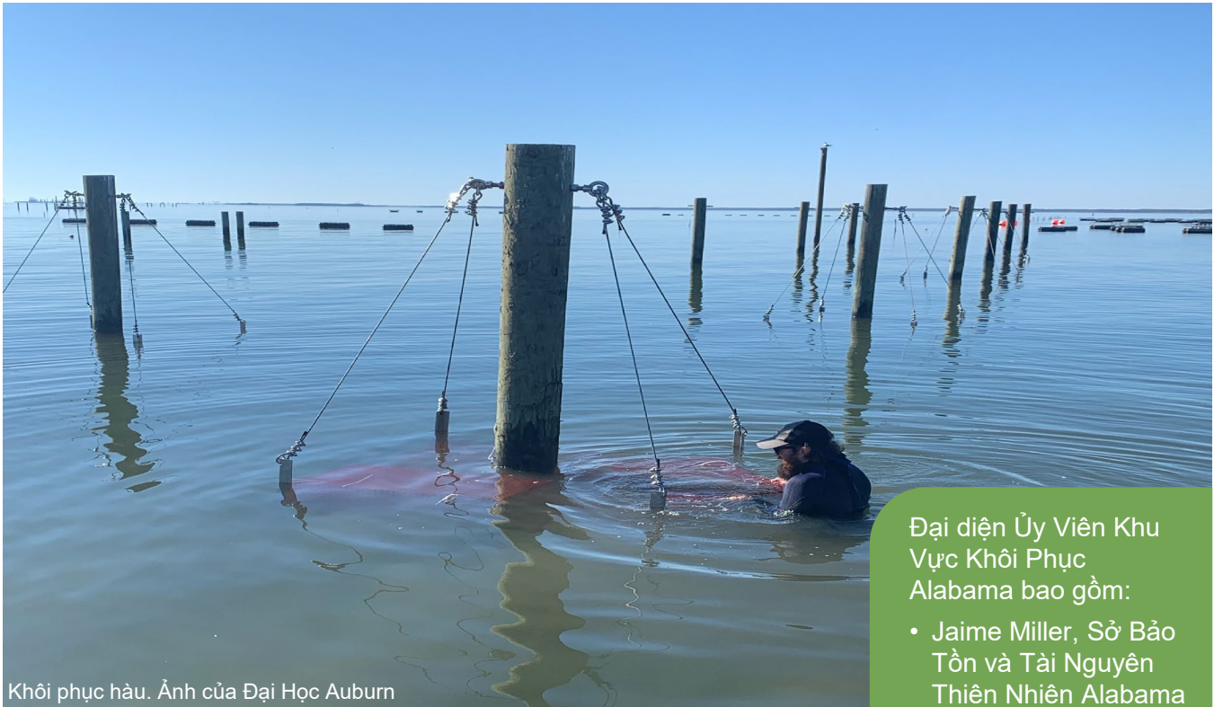
Khôi phục hào.

Đại diện Ủy Viên Khu Vực Khôi Phục Alabama bao gồm: