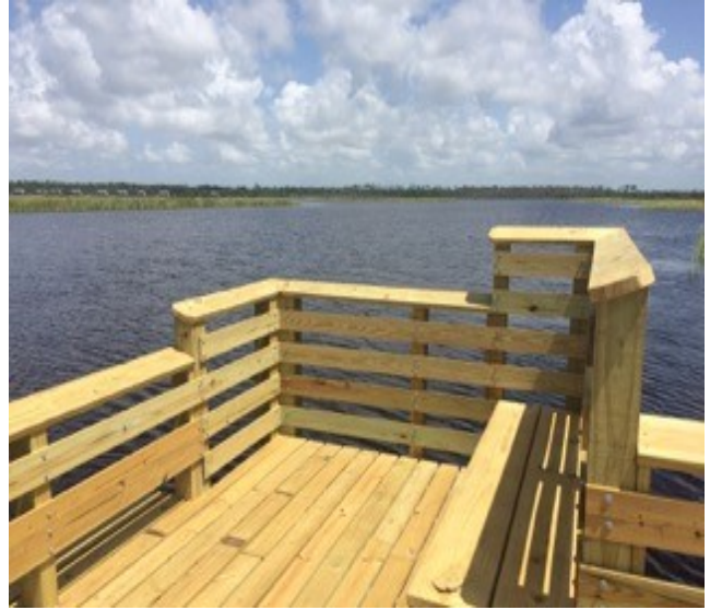
Cầu tàu Câu cá Hồ Shelby, một nâng cấp công viên hiện có sẽ kết nối với hệ thống xe điện được đề xuất.

3115 Five Rivers Boulevard Spanish Fort, AL 36527 ALTIG@dnr.alabama.gov