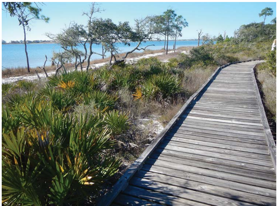
Một phần của Đường mòn Jeff Friend hiện tại chạy song song với bờ biển Little Lagoon.

Dự án đề xuất sẽ thay thế 1.250 foot phần lát gỗ của đường mòn bằng một lớp vật liệu tổng hợp. Phần 3.700 foot lát sỏi của con đường sẽ được thay thế