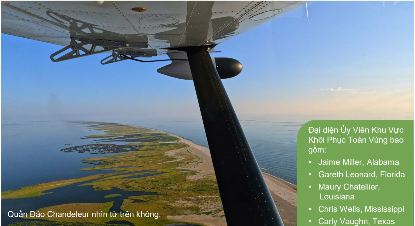
Quần Đảo Chandeleur nhìn từ trên không.