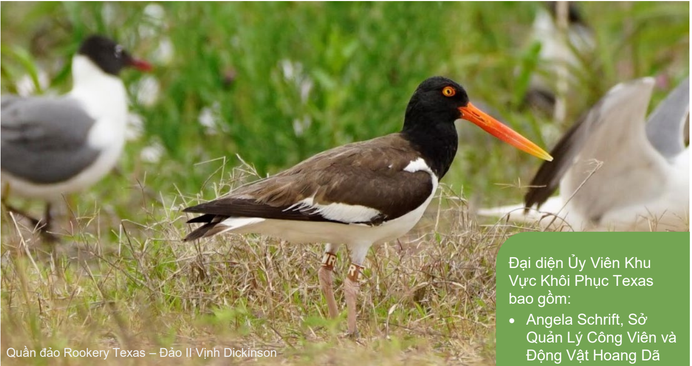
Quần đảo Rookery Texas – Đảo Il Vịnh Dickinson

Đại diện Ủy Viên Khu Vực Khôi Phục Texas bao gồm: