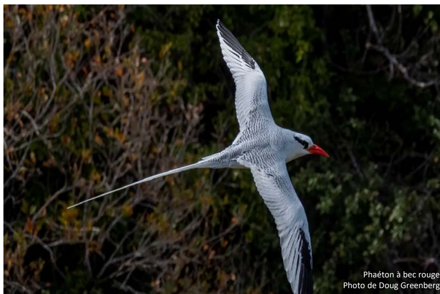
Phaéton à bec rouge